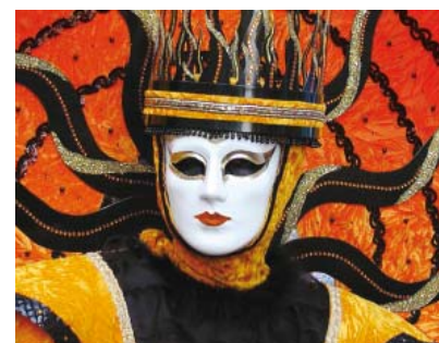
Dodanie nowego elementu MASKA