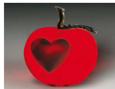
Zmiana barwy JABŁKO