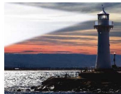
Efekt światła LATARNIA